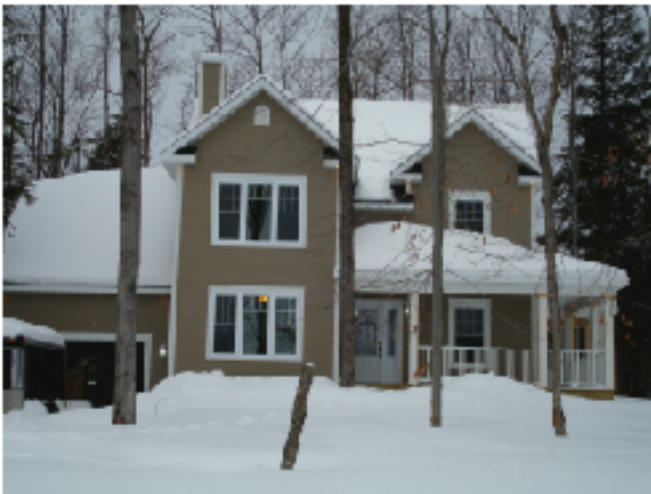
Modele avec garage